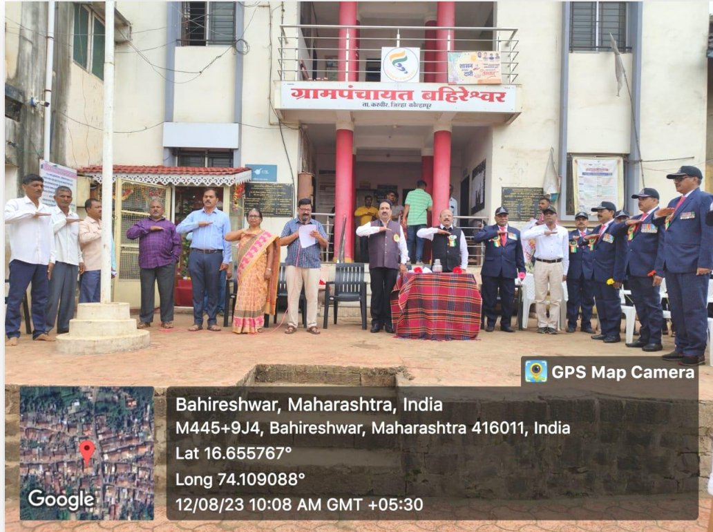
Figure 3: Dignitaries on the stage taking the Panchaprana oath

पंचप्रण शपथ घेताना व्यासपीठावरील मान्यवर