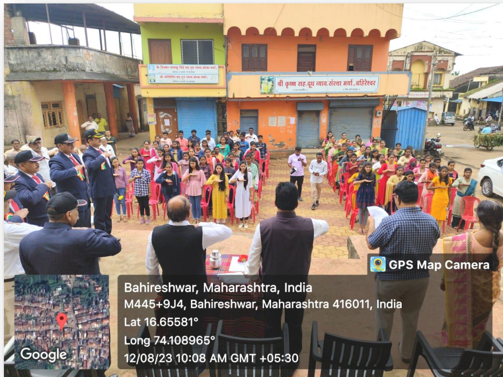
Figure 4: NSS Volunteers taking Panchprana Oath

पंचप्रण शपथ घेताना व्यासपीठावरील मान्यवर