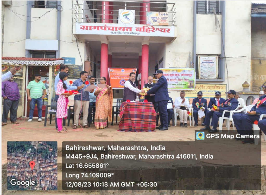
Figure 1 : Principal of the college felicitating ex-servicemen. माजी सैनिकांचा सत्कार करताना महाविद्यालयाचे प्राचार्य