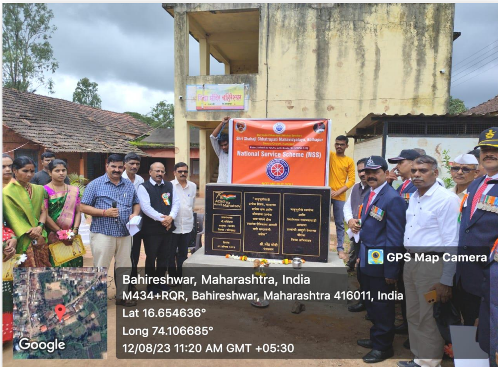
Figure 2: A Commemorative Foundation Stone was revealed in the hallowed grounds of the Bahireshwar Village's Primary School. बहिर्श्वर गावातील प्राथमिक शाळेच्या पवित्र मैदानात स्मारकाची पायाभरणी करण्यात आली.