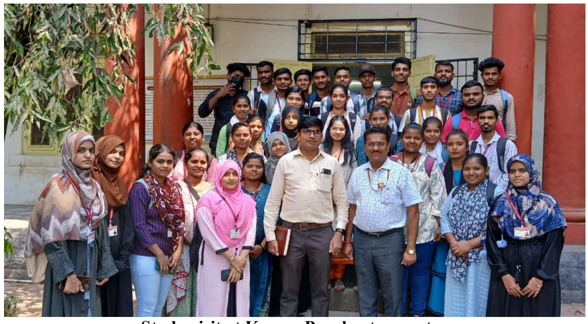
Study visit at Karver Panchvat sameetee