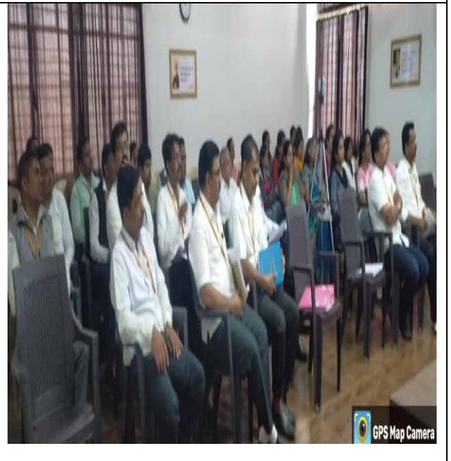
Dignitaries present for the event.