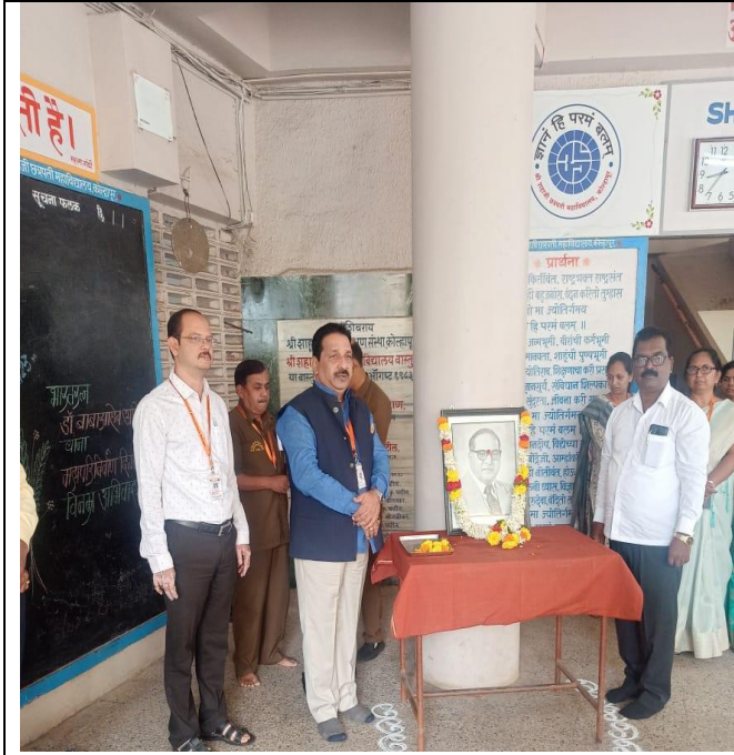
Dignitaries worshipping the image of Dr. Babasaheb Ambedkar