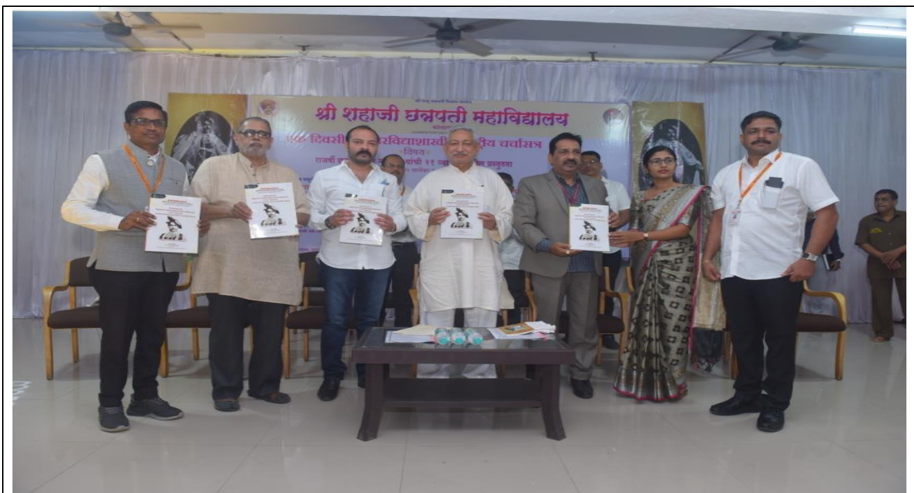
The book titled " Rajarshi Chhatrapati Shahu Maharaj: His Relevance in the 21st Century ", organized by the Department of History, Department of Political Science, and IQAC on Wednesday, 25th September 2024, was released at the hands of Member of Parliament Shahu Maharaj and other dignitaries.