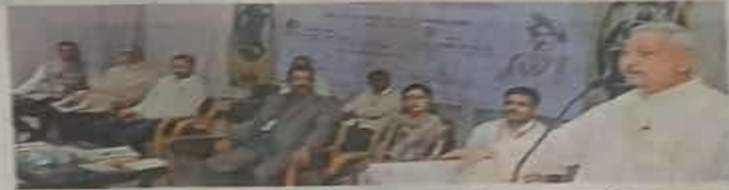
कोल्हापूर : राष्ट्रीय चर्चासत्रात बोलताना खासदार श्रीमंत शाहू छत्रपती महाराज.