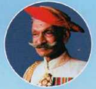
श्री शहाजी छत्रपती महाराज