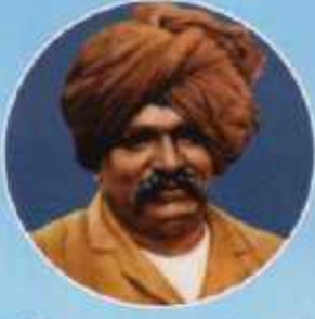
राजर्षी शाहू छत्रपती महाराज